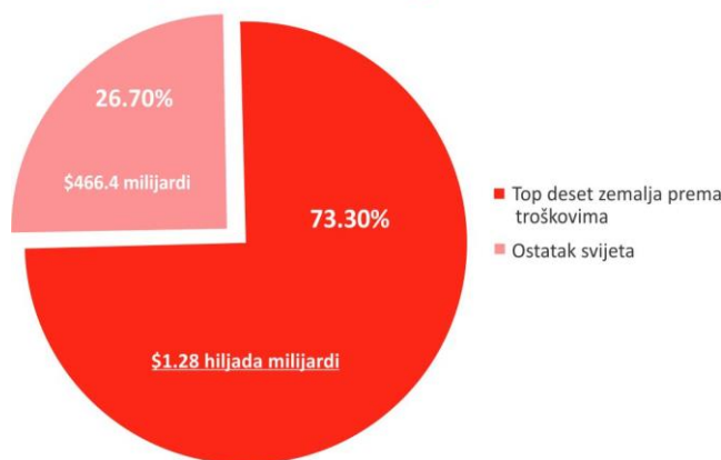
Troškovi za vojsku na globalnom nivou 2013. godine

U periodima neposredno prije, tokom i nakon sukoba, državne institucije su najslabije i mijenjaju prioritete, preusmjeravaju finansiranje i resurse od osnovnih potreba prema budžetima za vojsku i odbranu; ovo naročito utiče na obrazovanje. Slom državnih struktura, veoma često unutrašnje sigurnosti, uspostavlja nesigurne uslove za žene i djevojčice i spriječava ih od putovanja u školu. 8