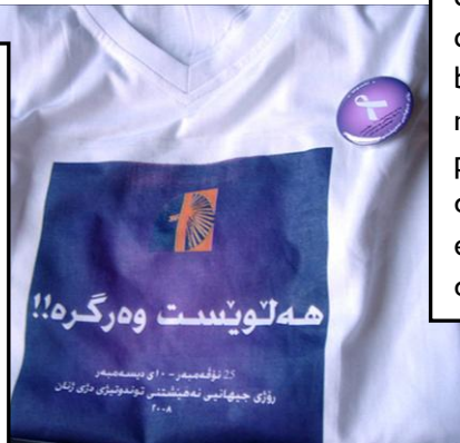
© Asuda for Combating Violence Against Women (2008) Iraq