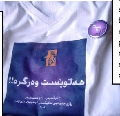
© Asuda for Combating Violence Against Women (2008) Iraq