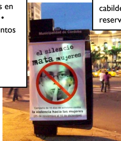
© Hilando las Sierras (2009) Argentina

Organice discursos públicos, marchas, manifestaciones, protestas o viglias en honor de las víctimas de violencia • Emplea tambores y otros instrumentos en su activismo • Participe en programas de radio y televisión • Saque campos pagados en lugares públicos visibles.